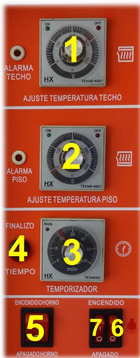
FIGURA 3. PANEL DE CONTROL